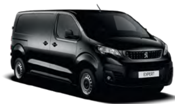
Crna Perla Nera