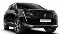
Crna Perla Nera