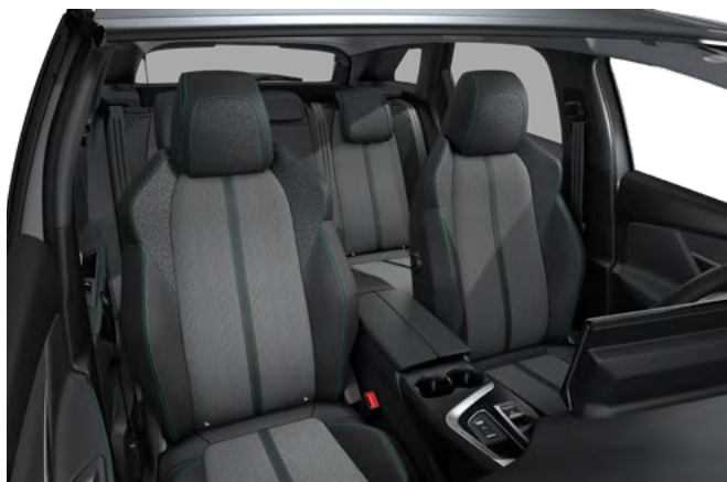
Unutrašnjost u kombinaciji "Leatherette" sa "Colyn" platnom i Mint šavom