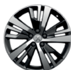
Aluminijumska felna 18" DETROIT