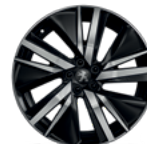
Aluminijumska felna 19" SAN FRANCISCO