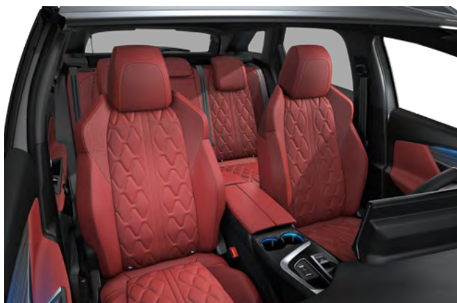
Nappa crvena kožna unutrašnjost sa "Aikinite" šavom